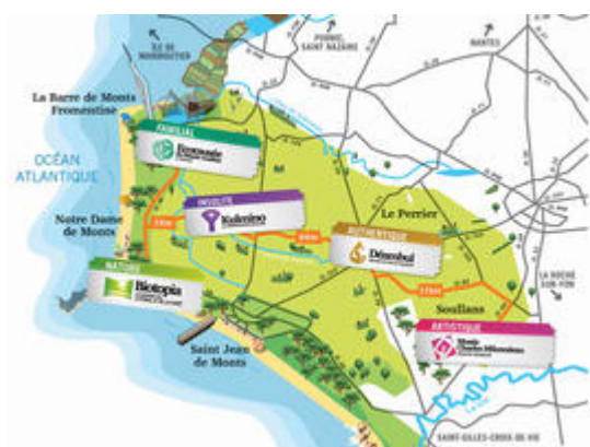
Les autres sites de visite en marais vendéen.